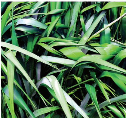
Whakaahua nā tētehi tamaiti, e 8 ōna tau.

Me he kāmera ā ngā tamariki, ka āhei hoki rātou ki te whakaahua i te rākau, ki te tini i te pānga atu o te aho, i te taitapa hoki o te pikitia. Mā konā, ka aro atu rātou ki ngā wāhanga rerekē me ngā taipitopito o te rākau. Mēnā ka taea e rātou te tiki ake i tētahi momo taupānga whakaraweke whakaahua, ka taea te rāwekeweke i ngā whakaahua o te harakeke. Ko te aronga nui o tēnei momo ngohe ko te taha toi, arā, ko ngā momo mahi whakapaipai whakaahua pērā i te haukoti āhua, i te tātari aho, i te kauruki whakaahua me te rāwekeweke i ngā kano.