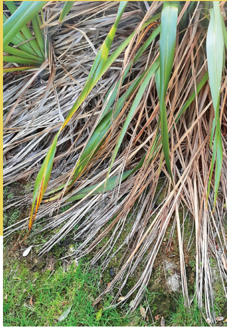
Ngā rau tūpuna o te harakeke.

Hā Ora: Te Ahi Kātoro Tau 2–4 (Taumata 1–2)